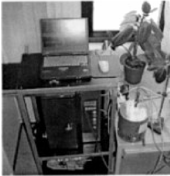
Figure 1. Test set up.