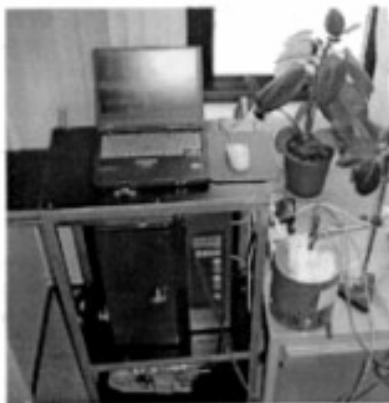
Figure 1. Test set up.

The air cleaner was placed on a desk. The concentration was measured by altering between up- and down-stream (15 mm above the outlet in the center) of the air cleaner. An ELPI (Electrical Low Pressure Impactor, Dekati FIN) was used to measure numbers and sizes of the particles.